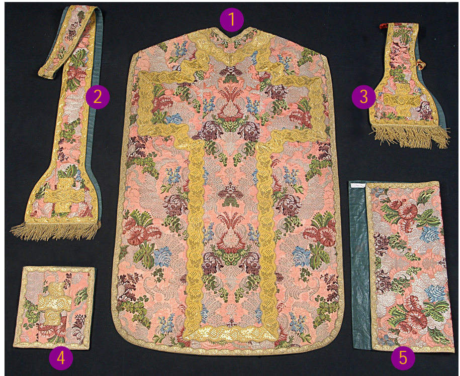
Ornement rose provenant de la cathédrale Saint-Jean-Baptiste (Perpignan)

De forme carrée ou rectangulaire, le voile de calice est ornée au centre d'une croix et rehaussé d'un galon périphérique. Il est placé sur le calice et la patène quand celui-ci n'est pas utilisé.