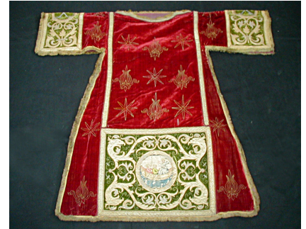
Dalmatique rouge de l'église de Collioure

Cet ornement liturgique, dérivé d'un vêtement civil romain, est ce que l'on nomme une dalmatique. En forme de croix en T avec des manches courtes, la dalmatique est l'ornement propre aux diacres (personnes ayant reçu le premier degré du sacrement de l'ordre). Fendue sur les côtés et sous les bras, la dalmatique se porte lors de la messe, des processions et des vêpres. Elle est accompagnée d'un col assorti, amovible : le collet de dalmatique.