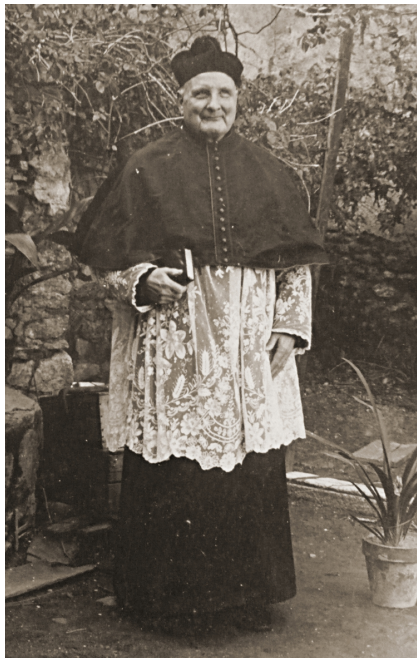
Curé de Villelongue-dels-Monts, revêtu d'une soutane, surmonté d'un surplis, les épaules couverte d'une mosette et la tête coiffé d'une barette