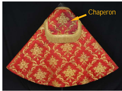
Chape rouge provenant de la cathédrale Saint-Jean-Baptiste (Perpignan)